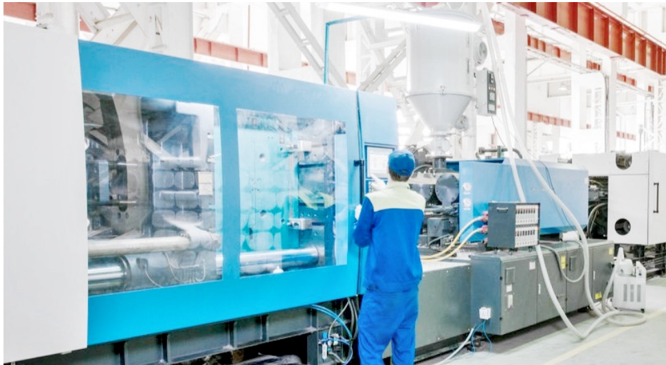
L'aumento dei costi

dell'energia e del gas in Europa sta mettendo a dura prova i trasformatori di materie plastiche e l'Italia non fa eccezione. Soprattutto se si considera che il caro bolletta s'innesta in uno scenario già gravato dall'aumento dei costi delle materie prime e della logistica, ponendo un punto interrogativo sulla stessa sopravvivenza delle imprese del settore.