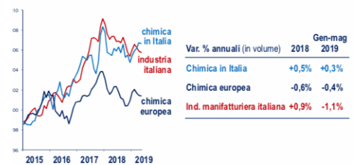
Produzione chimica e manifatturiera (indici 2015=100)

A pesare sullo sviluppo del settore non è solo la forte contrazione dell'auto, importante utilizzatore di prodotti chimici; risultano in affanno o in sostanziale stagnazione quasi tutti i settori clienti, ad esclusione del largo consumo (alimentare e cosmetica, in particolare).